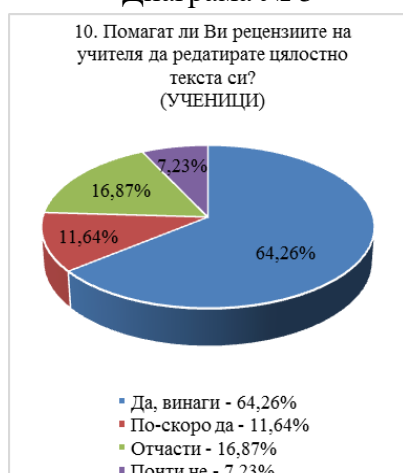
Диаграма № 5