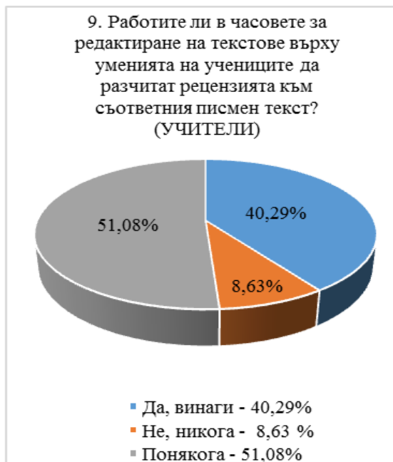
Диаграма № 3