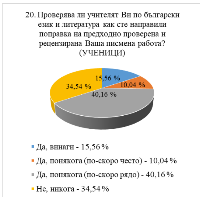
Диаграма № 12