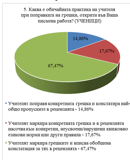
Диаграма № 1