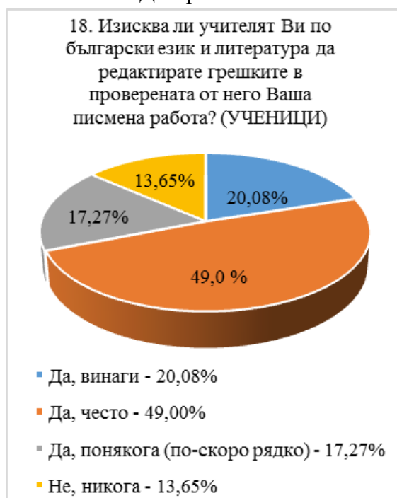
Диаграма № 8